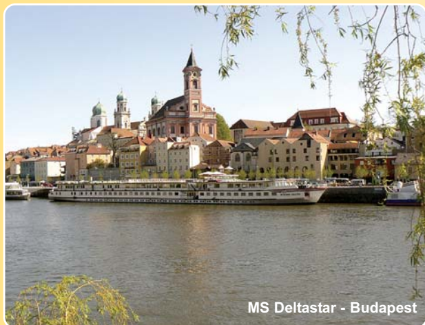
MS Deltastar - Budapest

Diese Reise, auf der Sie nicht weniger als 7 Länder passieren, führt durch eine faszinierende und vielfältige Landschaft bis zum Donaudelta. Die im Verlauf bis zum Delta wechselnden Landschaftsbilder sind beeindruckend. Sie bereisen die Slowakei, Ungarn, Serbien, Rumänien, Ukraine und Österreich. Lassen Sie sich dabei von der landschaftlichen Vielfalt, charmanten Metropolen und kleinen Städtchen bezaubern. Der Besuch der beiden 'Königinnen der Donau', Wien und Budapest, steht dabei ebenso auf dem Programm, wie die liebevoll restaurierte Altstadt von Bratislava. Sie durchfahren die beeindruckende Flusslandschaft der Katarakten, eine 100 km lange, faszinierende Schlucht zwischen den Karpaten und dem Balkangebirge. Dahinter erstreckt sich die Walachei, wo Rumäniens Hauptstadt Bukarest Sie begrüßt. Dort wo sich bei Tulcea die Donau in zwei Arme teilt, erreichen Sie mit Ausflugsbooten das rumänische Donaudelta. Hier hat sich eine für Europa einmalige Schilflandschaft gebildet, die mehr als 300 Vogelarten beherbergt. Auf einer knapp 6.000 km 2 großen Fläche aus Wasser, Schilf und Moor können Sie das letzte Naturparadies Europas entdecken. Auf diesem Fleckchen