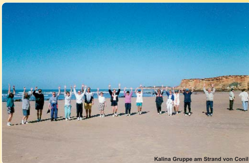
Kalina Gruppe am Strand von Conil

Zum Abendessen können Sie zwischen verschiedenen Möglichkeiten wählen: Das Hauptrestaurant, das auch Frühstück anbietet, lockt mit einem exzellenten Buffet und einer riesigen Auswahl an Gerichten (Halbpension), während Sie im gemütlichen À-la-carte-Restaurant regionale, nationale und internationale Spezialitäten genießen können. Natürlich können Sie auch den Zimmerservice in Anspruch nehmen.