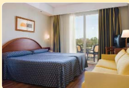
Hotel Flamenco Conil