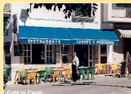
Café in Conil