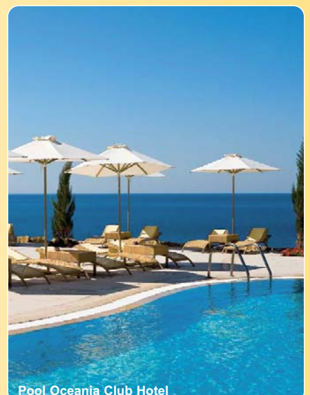
Pool Oceania Club Hotel