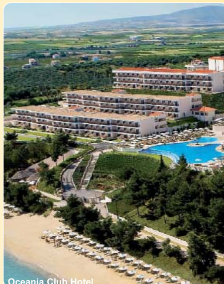
Oceania Club Hotel